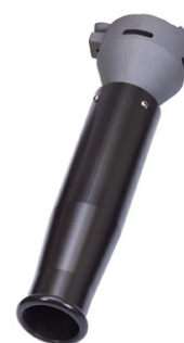
Lança de Espuma Modelo 214